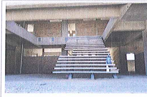
F5: Interior de aula