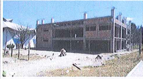
F1: Fachada principal